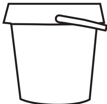
600шт в ведре (18x20см)