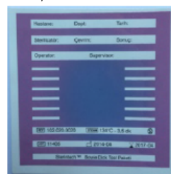
3) Liiga vähe vaakumi