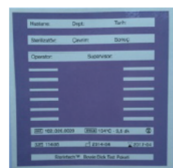
2) Pole vaakumit / pole auru